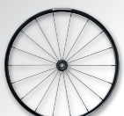
ลายและสียาง