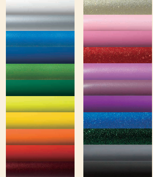
สีโครงรถวีลแชร์

ตัวอย่างชิ้นส่วนบางส่วน ที่ท่านสามารถเลือกได้ ด้วยตัวท่านเอง (เฉพาะรุ่น A-MAX)